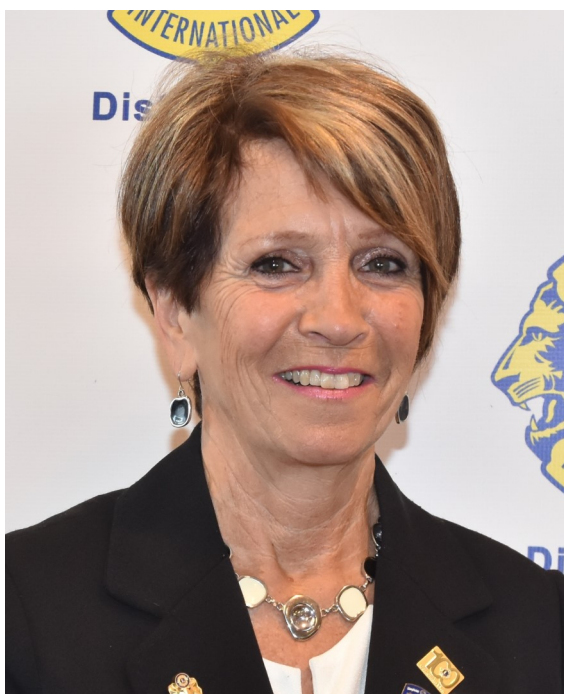
Janine Dumont, Gouverneure