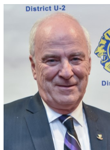
Gaston Carrier Site Web