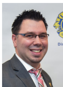
Simon Jomphe Relations Publiques