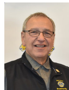
Réjean Labrecque Agenda Gouverneure