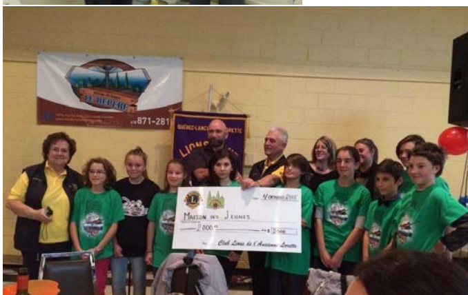
Remise d'un chèque de 2 000 $ à la Maison des Jeunes pour la réalisation de leurs projets.