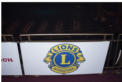
Les Lions étaient clairement bien en vue lors de cette soirée!

Lion André Duval, ppc C.A. Fondation des maladies de l'œil