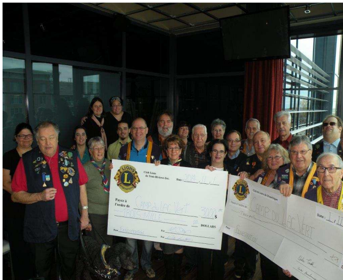
Remise de chèque au Responsables du Camp du Lac Vert par les Club Lions de Shawinigan et Trois-Rivières